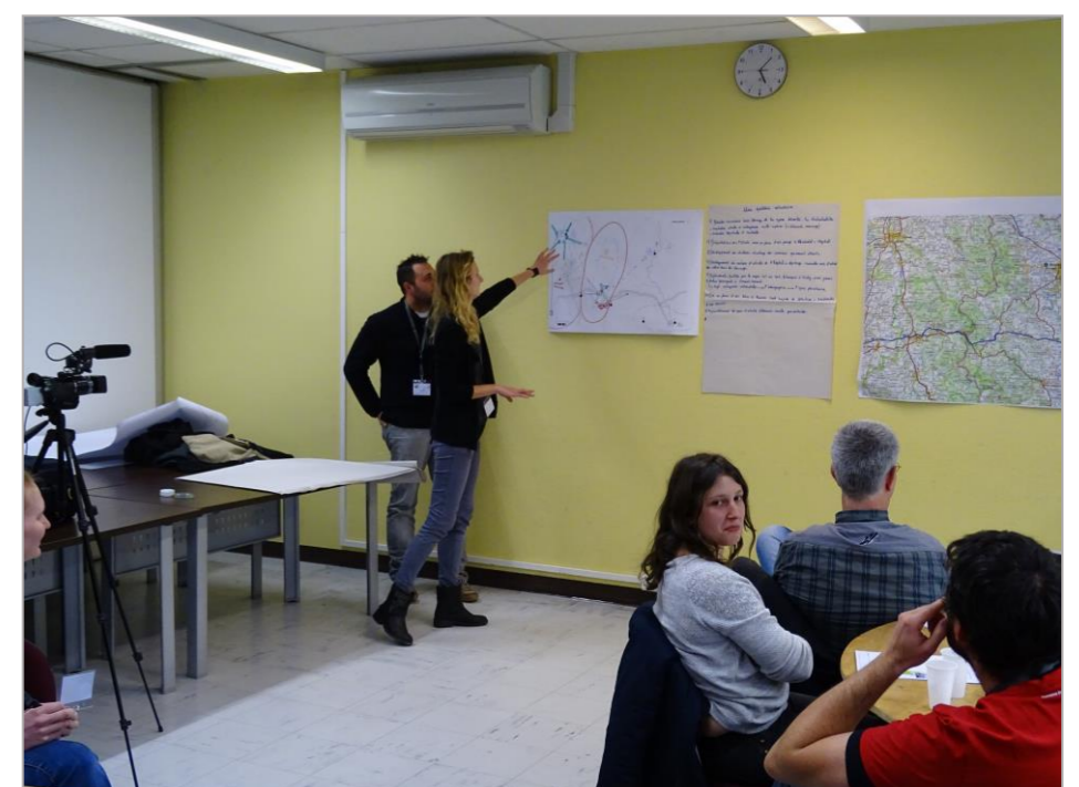
Photo 5. Des restitutions collectives sont organisées entre groupes de joueurs. Ils permettent de découvrir encore plus largement d'autres réflexions permettant aux étudiants de se décentrer de leurs représentations.