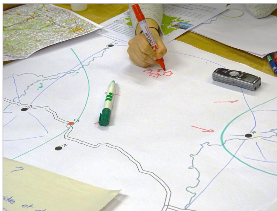
Photos 1 et 2. Le dessin rend l'activité plus agréable, et favorise l'échange des participants autour de leurs représentations socio-spatiales. C'est la clé du dispositif.